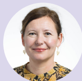
Naja Hulvej Rod Afgået forperson

Vi ønsker jer god læselyst med denne årsberetning fra Vidensråd for Forebyggelse!